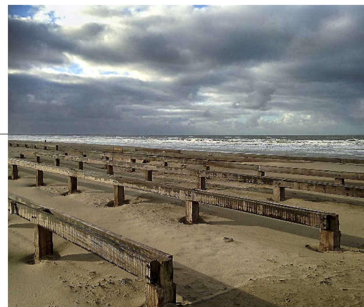
Begin maart heerst nog rust en stilte op het strand. Dat zal niet lang meer duren.