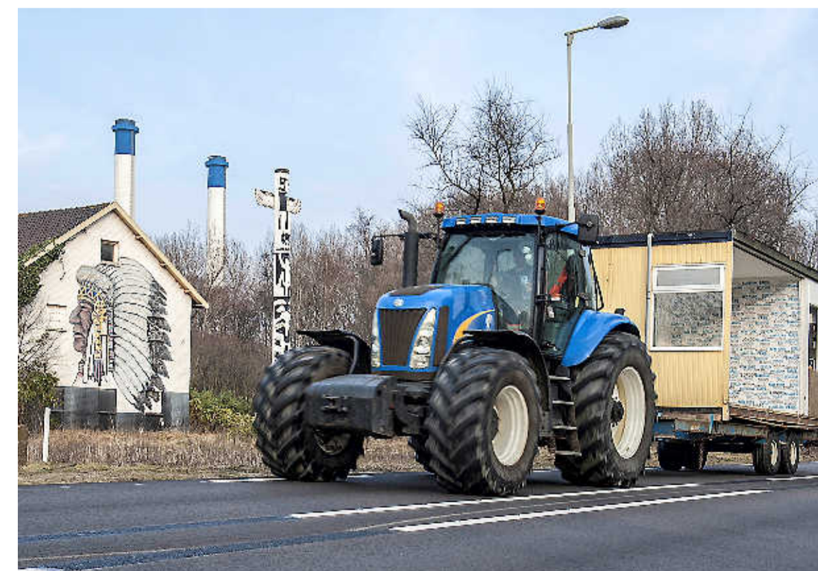
Als lentebodes vervoeren wekenlang tractoren strandhuisjes naar het strand.