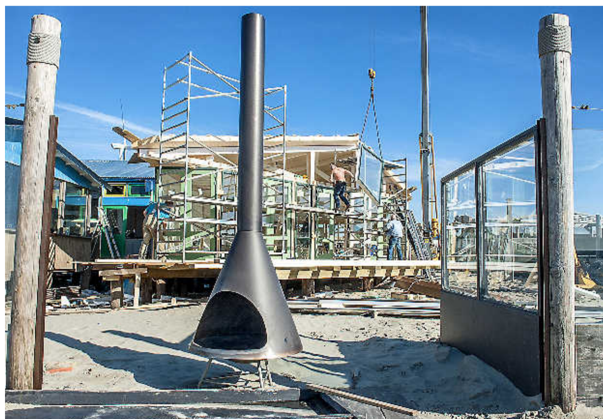
Naast het nieuwe strandpaviljoen Aloha bouwt Outstanding Events een eigen onderkomen.